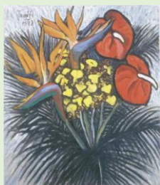
北川民次 「極楽鳥花とアンスリウム」