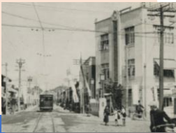
画像：桑名市街絵葉書より、戦前の旭橋通を走る桑名電軌