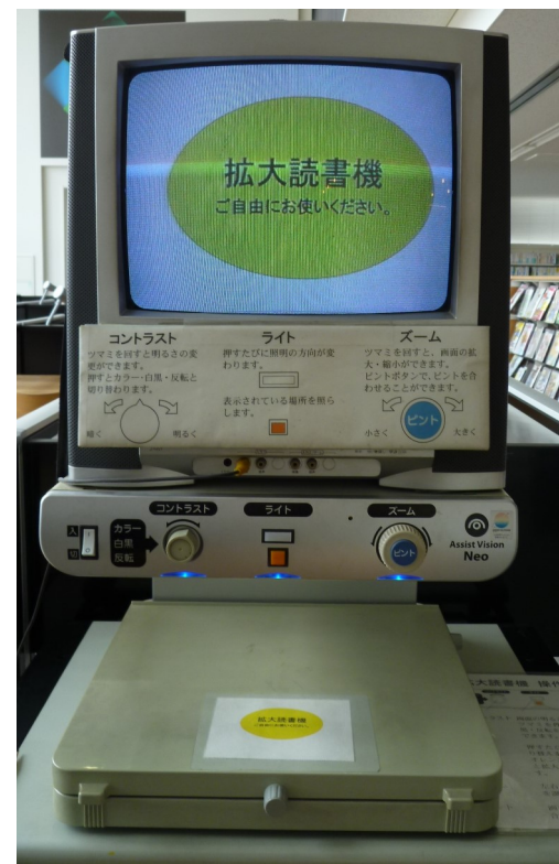
かくだいどくしよ き 拡大読書器

つか かた 使い方が わ からない と きは と しよ かん ひ と き 図書館の人に き 聞いてください